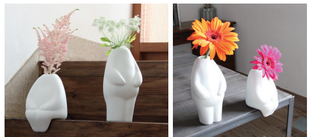
活ける花により、キャラクターも変わります