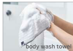
body wash towel