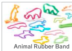
Animal Rubber Band

+dは、デザイナーがモノに込めた想いやメッセージを世界に届けるブランドです。初めて製品化したアニマルラバーバンドをはじめ、100名を超えるデザイナーのメッセージを形にしています。