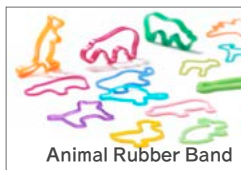
Animal Rubber Band

「h」から始まる言葉を大切にhconceptが使う人と一緒にデザインしました。生活に溶け込むシンプルさの中に個性や工夫が詰まっている。暮らしの新しいスタンダードです。