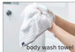
body wash towel