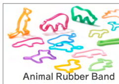
Animal Rubber Band

+d は、デザイナーがモノに込めた想いやメッセージを世界に届けるブランドです。初めて製品化したアニマルラバーバンドをはじめ、100名を超えるデザイナーのメッセージを形にしています。