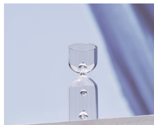
株式会社鎌田理化学器械製作所 Sekiei セキエイ

純度99.9%のカーボン(炭素)の塊から削り出して作られる調理器具。炭火焼と同等の遠赤外線を発生し、素材本来の旨味を引き出す。炭火と違い面倒な火おこしが不要で、フッ素コーティングにより焦げにくい。トースト、肉、野菜など誰でも簡単においしく調理できる。