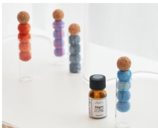
NPO法人 ディーセントワーク・ラボ equalto イクォルト

石川県 山中漆器の産地に1925年に創業し、さまざまな食器製品を生み出す株式会社竹中が立ち上げたフードウェアブランド。FUN+TOUGH+CREATIVEをコンセプトに、暮らしの大切なひとときとなる、楽しい「食べる」を提供する。