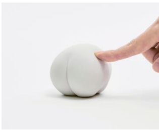
アッシュコンセプト New Line HATENALABO ハテナラボ

おや？ はて？ なんだろう？ 新しい発見や、楽しみとの出会いの場に育つかも知れない、頭に浮かんだ小さな「？(はてな)」の大きな力を信じて、日常に心地よい違和感や、柔らかな驚きを届ける、実験装置の研究・デザインを提案。