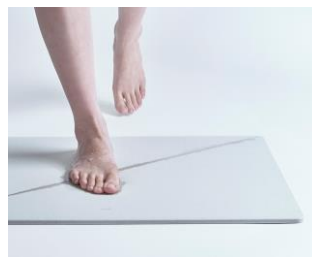
soil株式会社 soil ソイル

おや？ はて？ なんだろう？ 新しい発見や、楽しみとの出会いの場に育つかも知れない、頭に浮かんだ小さな「？(はてな)」の大きな力を信じて、日常に心地よい違和感や、柔らかな驚きを届ける、実験装置の研究・デザインを提案。