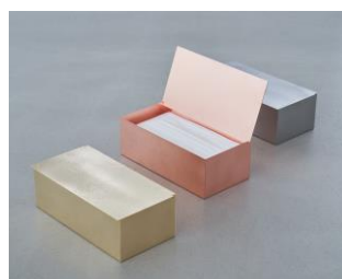
株式会社野口製作所 Ori オリ

「鉄鍋はサビる」という常識をくつがえす「チッカ黒染め処理」を施したプレス鉄鍋。表面が鉄の7倍もの強度となり、衝撃や摩耗・摩擦に強い。使用前の空焚きや保管のための油引きが不要。熱伝導性に優れ高温・短時間での調理が可能。