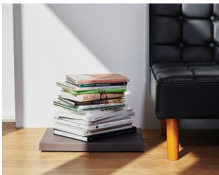
株式会社テラモト tidy ティディ

左官職人の技術と、珪藻土などの自然素材を用いて、人や環境にやさしいプロダクトをつくるsoil。調湿性や吸水、脱臭性に優れ、呼吸する素材としても注目される土の特性をそのままに自然の恵みを凝縮させたナチュラルで心地のよいデザインが特徴。