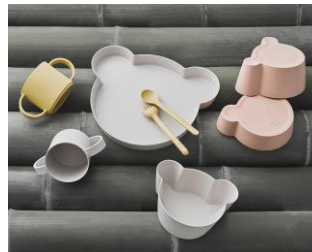
株式会社竹中 tak タック

業務用の清掃用品や人工芝などの環境美化用品の総合メーカーとして培った株式会社テラモトの技術を活かし、様々な生活用品を展開。使っているときはもちろん、使わないときもオブジェやインテリアとして楽しめるデザインをコンセプトとしている。