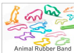
Animal Rubber Band