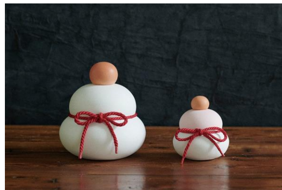
左 / KAGAMI MOCHI MS、右 / KAGAMI MOCHI kaga S

価格 S ¥5,060(税込) MS ¥7,700(税込) M ¥9,900(税込) サイズ S 約Φ80×H90mm MS 約Φ120×H135mm M 約Φ160×H170mm 材質 珪藻土(飾り紐付き) 発売 2022年6月15日(水) 日本製