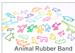
Animal Rubber Band

「h」から始まる言葉を大切にするhconceptが使う人と一緒にデザインしました。生活に溶け込むシンプルさの中に個性や工夫が詰まっている。暮らしの新しいスタンダードです。